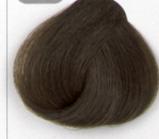
بلوند زیتونی روشن قوی