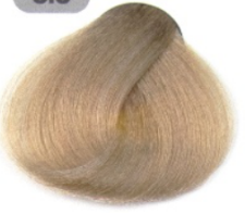
بلوند خیلی روشن