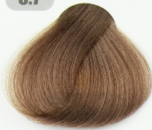
بلوند نسکافه ای تیره