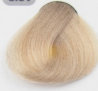
بلوند بژ روشن