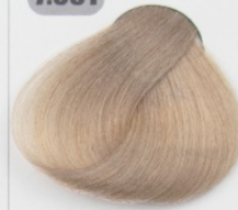
بلوند کثیف متوسط