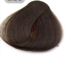
قهوه ای روشن قوی