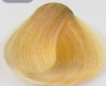
گلو سینگ طلایی