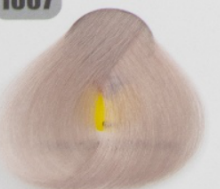
روشن کننده نسکافه ای