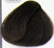
قهوه ای شکلاتی متوسط