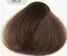
قهوه ای نسکافه ای روشن