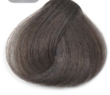
بلوند دودی تیره