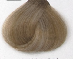
بلوند زیتونی خیلی روشن