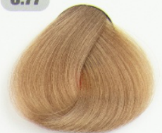
بلوند شیر شکلاتی روشن