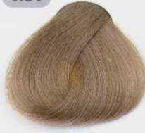
بلوند بژ متوسط