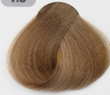
بلوند طلایی متوسط