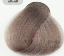
بلوند مرواریدی خیلی روشن (مرواریدی ابوابدر)