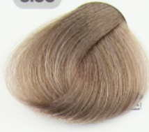
بلوند قوس و قزح روشن