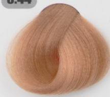
بلوند مسی روشن قوی