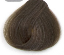
بلوند زیتونی متوسط