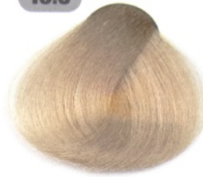
بلوند فوق العاده روشن