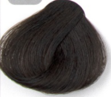
قهوه ای زیتونی روشن