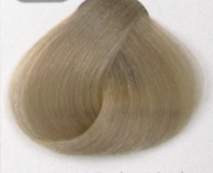
بلوند زیتونی فوق العاده روشن