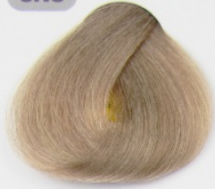
بلوند شنی ماسه ای روشن