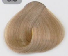
بلوند طلایی خیلی روشن