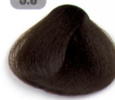
قهوه ای روشن