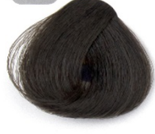
قهوه ای دودی روشن