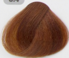
قهوه ای مسی روشن