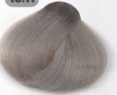
بلوند دودی فوق العاده روشن قوی