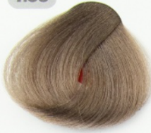
بلوند قوس و قزح متوسط