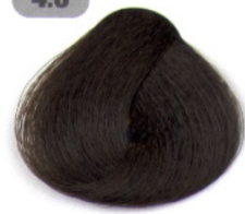
قهوه ای متوسط