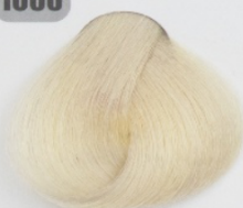
روشن کننده طبیعی