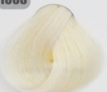
روشن کننده طلایی