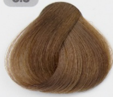
بلوند طلایی تیره