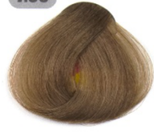
بلوند متوسط قوی