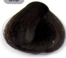
قهوه ای تیره