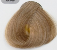
بلوند طلایی روشن