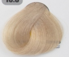
بلوند طلایی فوق العاده روشن