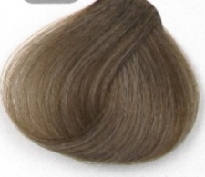
بلوند زیتونی روشن