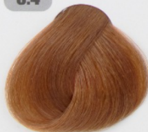
بلوند مسی تیره