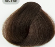
بلوند فندقی تیره