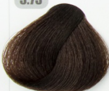
قهوه ای فندقی روشن