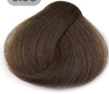
بلوند تیره قوی