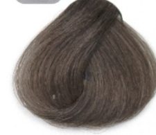
بلوند دودی متوسط