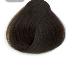
بلوند زیتونی تیره