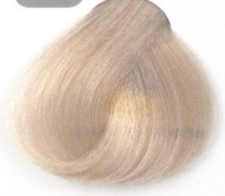
بلوند خاکستری فوق العاده روشن