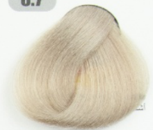
بلوند شیر نسکافه ای روشن