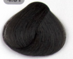
قهوه ای دودی طبیعی (مردانه)