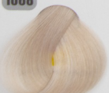
روشن کننده فوس و قرخ