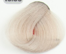
بلوند قوس و قزح فوق العاده روشن