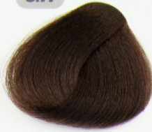
قهوه ای شکلاتی روشن