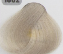
روشن کننده زیتونی