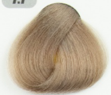
بلوند نسکافه ای متوسط (پس مو)