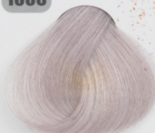
روشن کننده مدفی