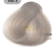
بلوند دودی فوق العاده روشن