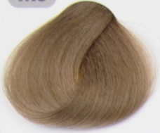
بلوند ماسه ای متوسط