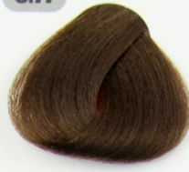
بلوند شکلاتی تیره