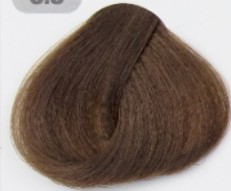
قهوه ای طلایی روشن