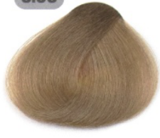
بلوند روشن قوی