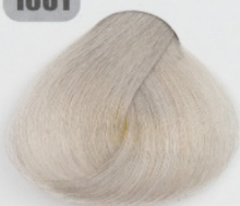
روشن کننده دودی