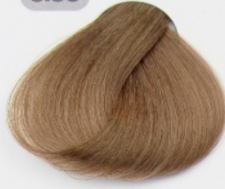
بلوند عسلی روشن