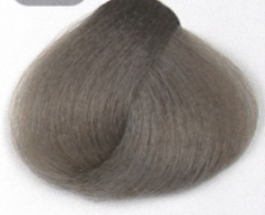
بلوند دودی روشن