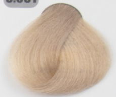
بلوند کثیف روشن