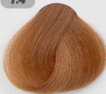
بلوند مسی متوسط