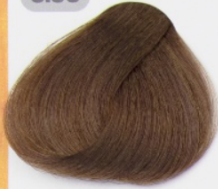
بلوند عسلی تیره