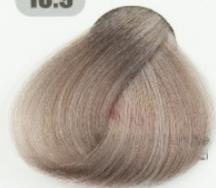
بلوند مرواریدی فوق العاده روشن