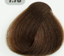
بلوند فندقی متوسط