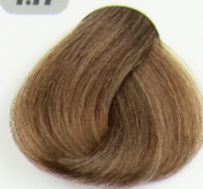
بلوند شکلاتی متوسط