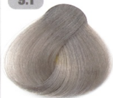
بلوند دودی خیلی روشن