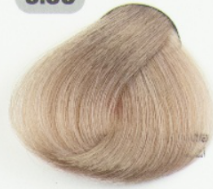
بلوند قوس و قزح خیلی روشن