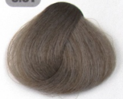
بلوند دودی طبیعی روشن