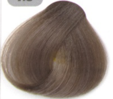
بلوند خاکستری متوسط