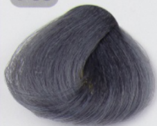
پیگمنت تیره ای