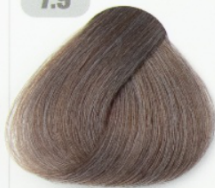
بلوند مرواریدی متوسط (مرواریدی ناهمبندی)