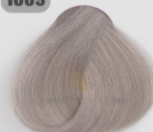
روشن کننده مرواریدی