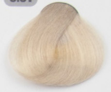
بلوند بژ خیلی روشن