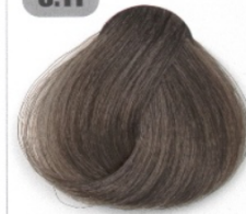
بلوند دودی روشن قوی